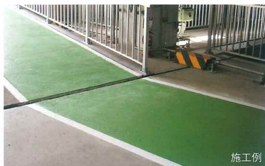
塗装色は#11グリーン