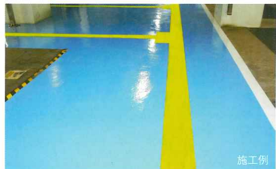
塗装色は#60スカイブルー(黄色は指定色) 施工例

※日塗り色見本には無いため色見本を掲載します。 ※この色見本は印刷物のため実際の色調とは多少異なります。 標準色の指定・選定・ご注文は必ず別冊の標準カラーサンプルをお願いします。