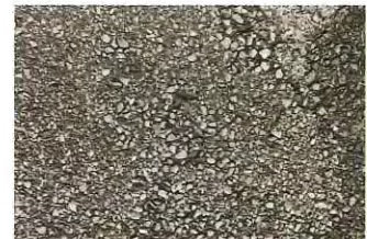
著しく劣化が見られるアスファルト面