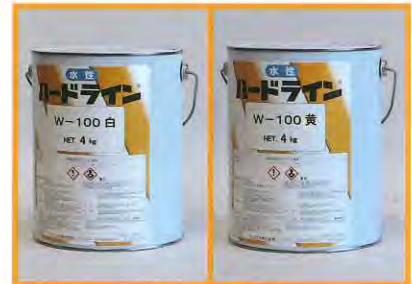
ライン引き用塗料 水性ハードラインW-100 白・黄