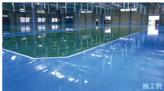
塗装色は#11グリーンと#60スカイブルー