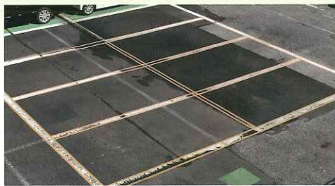
かすれたラインが…