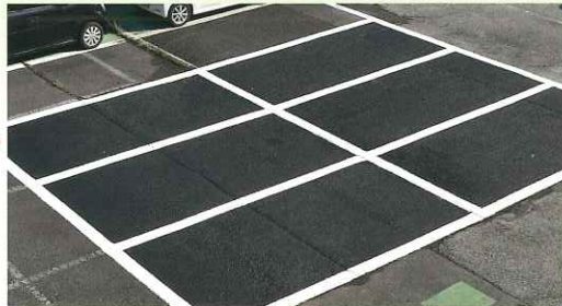
この通り！ ※ラインにはW-100、駐車面は水性パーキングブランクを施工しています。