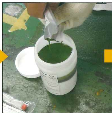
②骨材に主剤、硬化剤、硬化促進剤を投入します