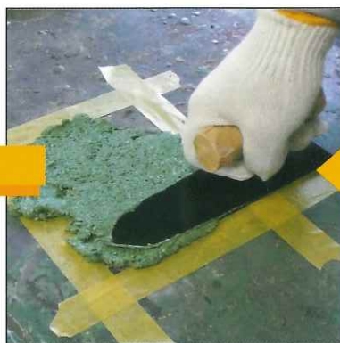
⑤付属のコテで材料を整えます