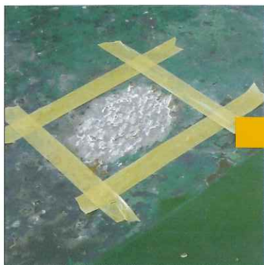
①施工箇所を養生します