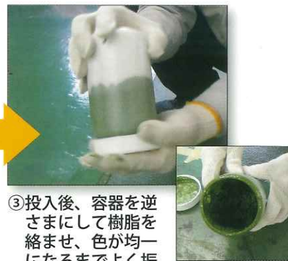
③投入後、容器を逆さまにして樹脂を絡ませ、色が均一になるまでよく振って混合します