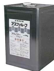
アスファルーフプライマー