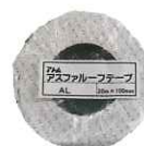
アスファルーフテープ